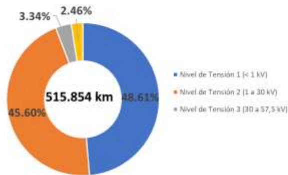
Figura 2. Redes de distribución de Colombia por nivel de tensión (basado en cifras 2010-2018 reportadas por Asocodis) 21

Los comercializadores de electricidad se encargan de comprar electricidad en el mercado mayorista y de suministrarla a los usuarios. Los usuarios, por su parte, se clasifican en consumidores regulados y no regulados (con una demanda mínima de 55 MWh/mes, o un consumo de 1 MW de potencia). Los usuarios no regulados pueden elegir a su comercializador y negociar los precios de generación y comercialización directamente a través de contratos bilaterales. Los usuarios regulados también tienen la posibilidad de elegir su comercializador, pero normalmente son atendidos por el comercializador incumbente (asociado a la empresa de distribución local), debido a mayores costos transaccionales ligados a otros comercializadores (por requerir la instalación de un nuevo medidor 22 ). Los usuarios regulados pagan una tarifa regulada establecida por la CREG, basada en la remuneración costo-efectiva de CAPEX y OPEX para las actividades de generación, transmisión, distribución y comercialización. A partir de la Ley 1715 de 2014 y sus posteriores actos reglamentarios, todo usuario que cumpla con las condiciones técnicas requeridas está habilitado a convertirse en autogenerador y entregar sus excedentes de energía a la red para ser debidamente remunerado 23 .