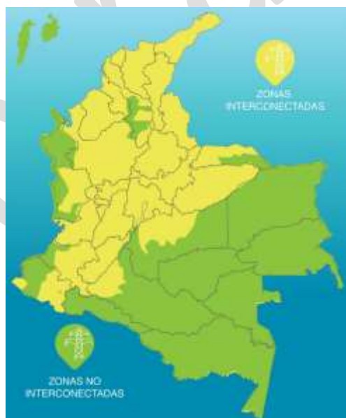
Figura 1. Áreas correspondientes al SIN y las ZNI en Colombia

El SIN cuenta con 28.448 km. de líneas de transmisión que interconectan 229 plantas de generación eléctrica con los usuarios finales del sistema a través de redes de distribución. Esta infraestructura se divide en el Sistema de Transmisión Nacional (STN) que incluye todas las redes en niveles de tensión de 220 kV o superior, y el Sistema de Transmisión Regional (STR) que incluye líneas entre 57,5 y 220 kV. El SIN fue diseñado para transportar energía de las plantas de generación tradicionales (combustibles hidráulicos y fósiles), que se encuentran principalmente en las regiones central y noroeste del país.